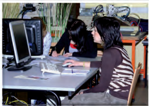
Etudes à l'aide d'un ordinateur et de logiciels de simulation

Lors du dernier trimestre, un projet est réalisé en groupe. Il consiste en l'amélioration de l'un des objets étudiés.