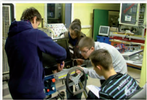
En SI, l'expérimentation se décline principalement en activités pratiques.