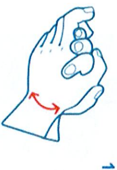
Paume contre paume

Les micro-ondes ne seront pas accessibles.