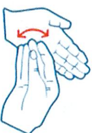
Friction en rotation en mouvement de va-et-vient et les doigts joints de la main droite dans la paume gauche et vice versa.