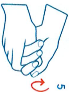
Friction circulaire du pouce droit enchaîné dans la paume gauche et vice versa