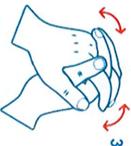
Paume contre paume, doigts entrelacés