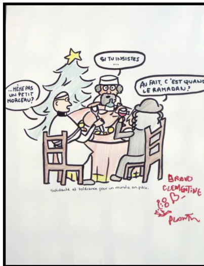
Clémentine PLOUYON 2nde 4