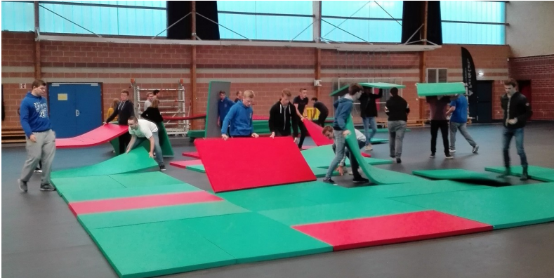
Montage des tapis en 5 minutes :record battu

De belles réalisations dans les épreuves où chacun et chacune a apporté sa pierre à l'édifice( les capitaines lycéens ont magnifié leurs équipes respectives,,,,,mission accomplie pour tous!)