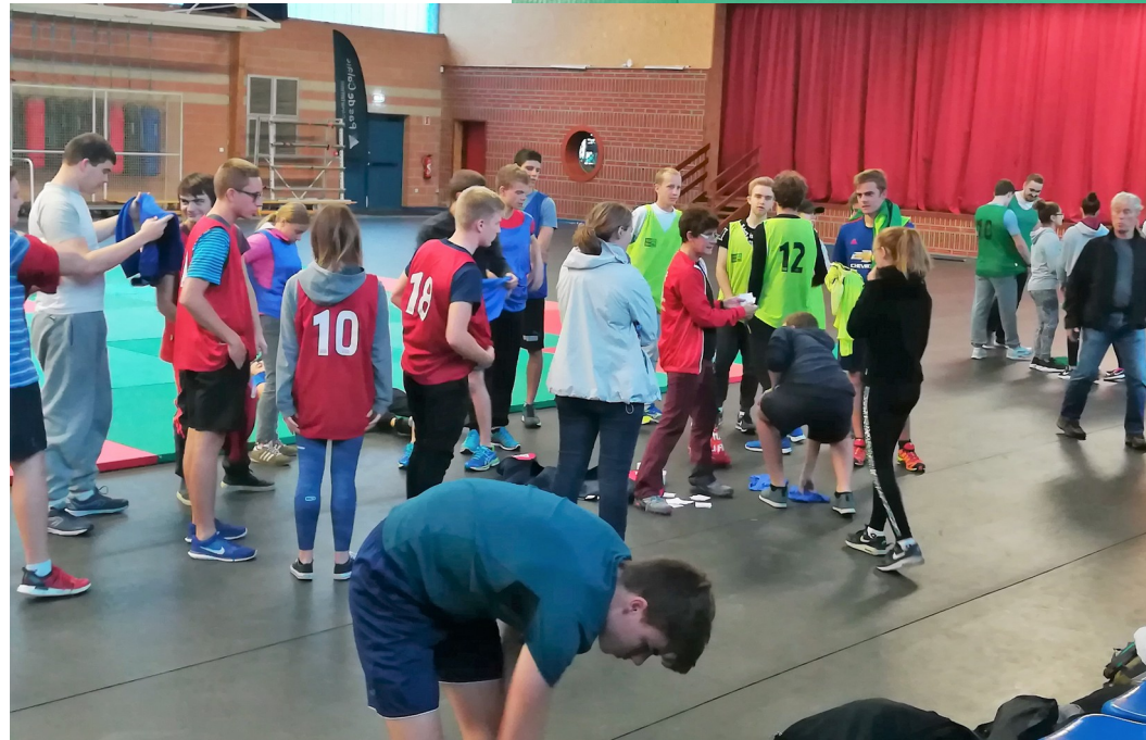
Les équipes sont tirées au sort