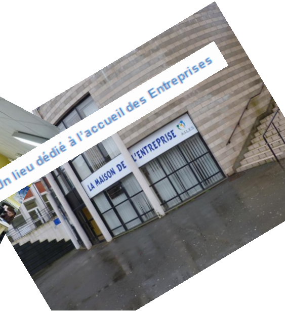
Un lieu dédié à l'accueil des Entreprises