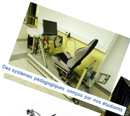
Des systèmes pédagogiques conçus par nos étudiants