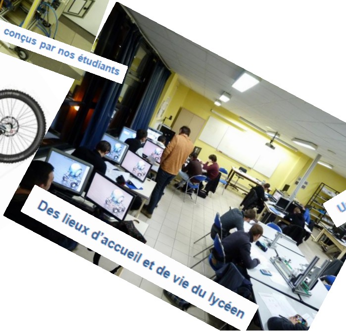
Des lieux d'accueil et de vie du lycéen